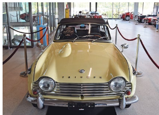
Des voitures aux allures de vedette. La diva du cinéma Sophia Loren aurait également conduit cette Triumph TR4.