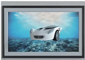
Rinspeed sera présent à la Photo Basel avec le 3D NFT Squba.

Rinspeed, connu pour ses créations automobiles extraordinaires, présente un NFT 3D unique à la Photo Basel. De tels NFT (Non Fungible Tokens, «pièces uniques indivisibles») sont actuellement encore un battage médiatique quelque peu nébuleux