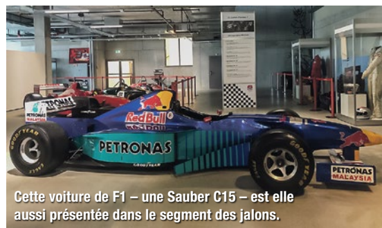
Cette voiture de F1 – une Sauber C15 – est elle aussi présentée dans le segment des jalons.